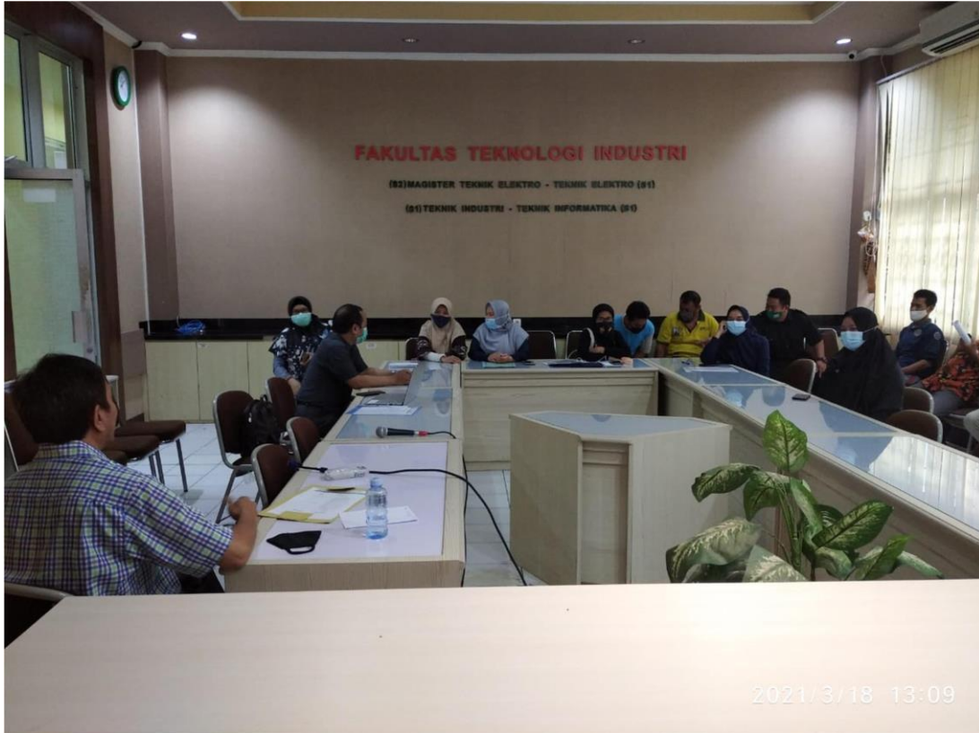
Gambar 2. Sosialisasi Tracer Studi Mahasiswa