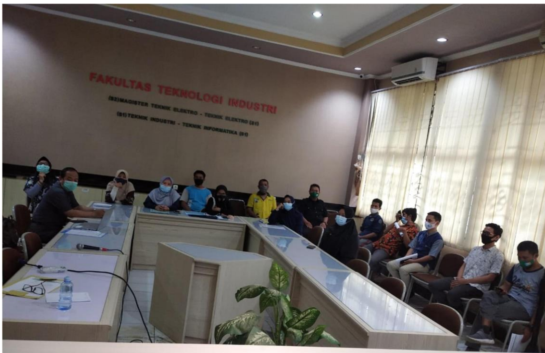
Gambar 3. Sosialisasi Tracer Studi Tenaga Kependidikan