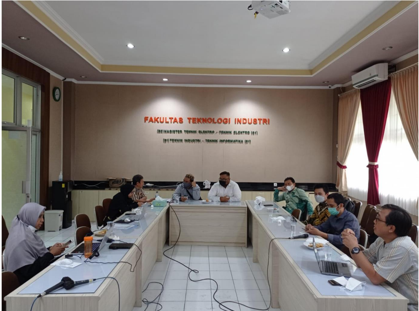
Gambar 1. Sosialisasi Tracer Studi Dosen